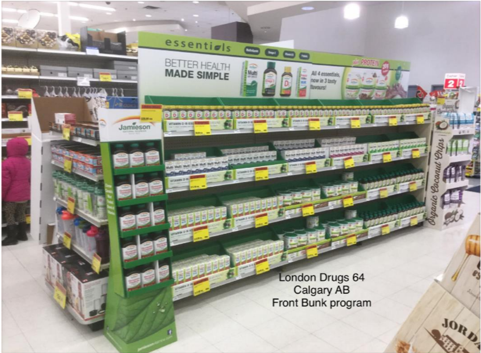
London Drugs 64 Calgary AB Front Bunk program