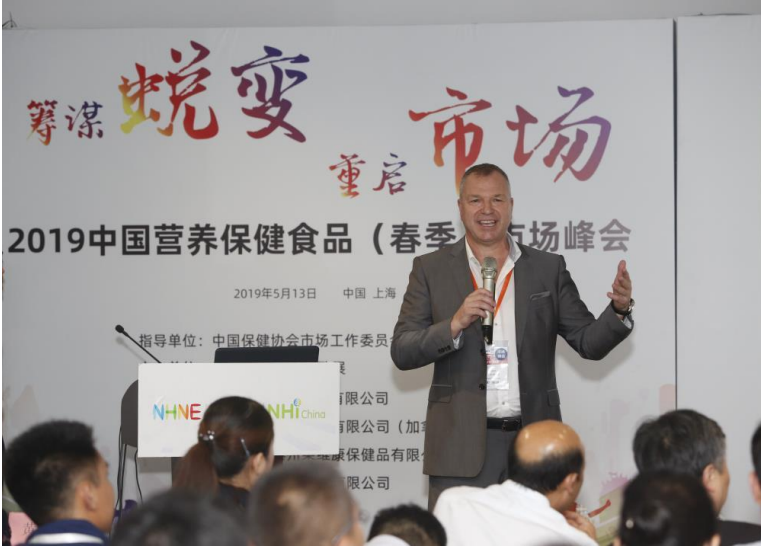
From May 13 to 15, NHNE was held in Shanghai.